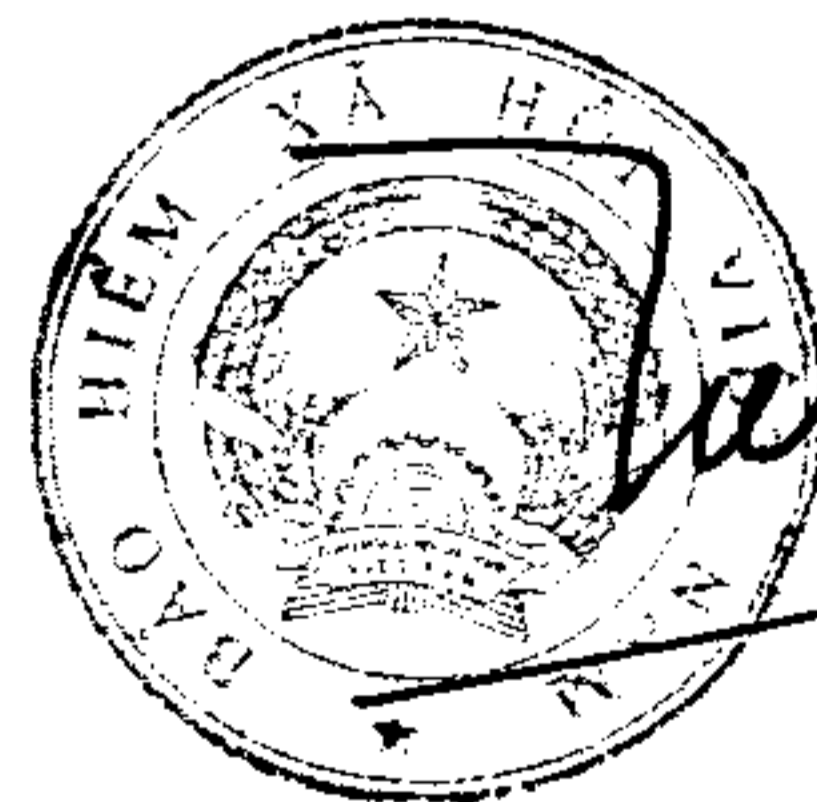
Đào Việt Ánh